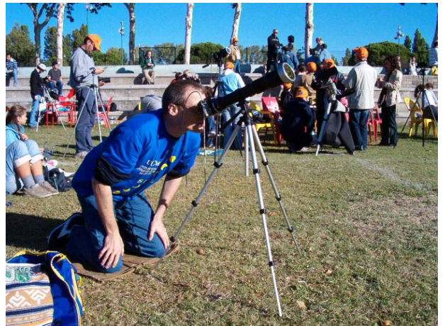
„Ja... wo laufen sie denn????“