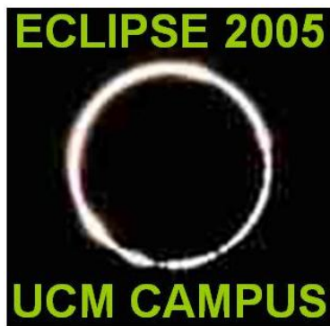
Das Logo der Uni in Madrid