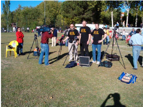
... und auch das Fernsehen (n-tv) ist live dabei!