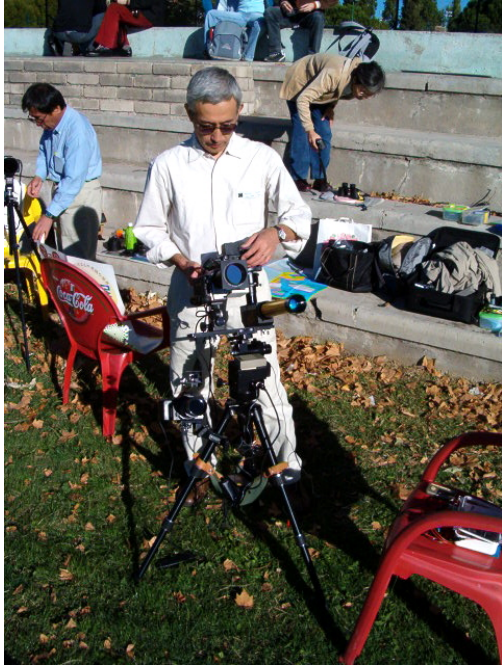
Erinnert mich irgendwie an „Mr. Roboto“, der japanische Kollege ;-))